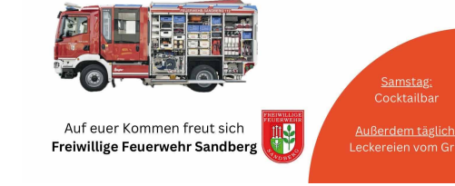
Auf euer Kommen freut sich Freiwillige Feuerwehr Sandberg